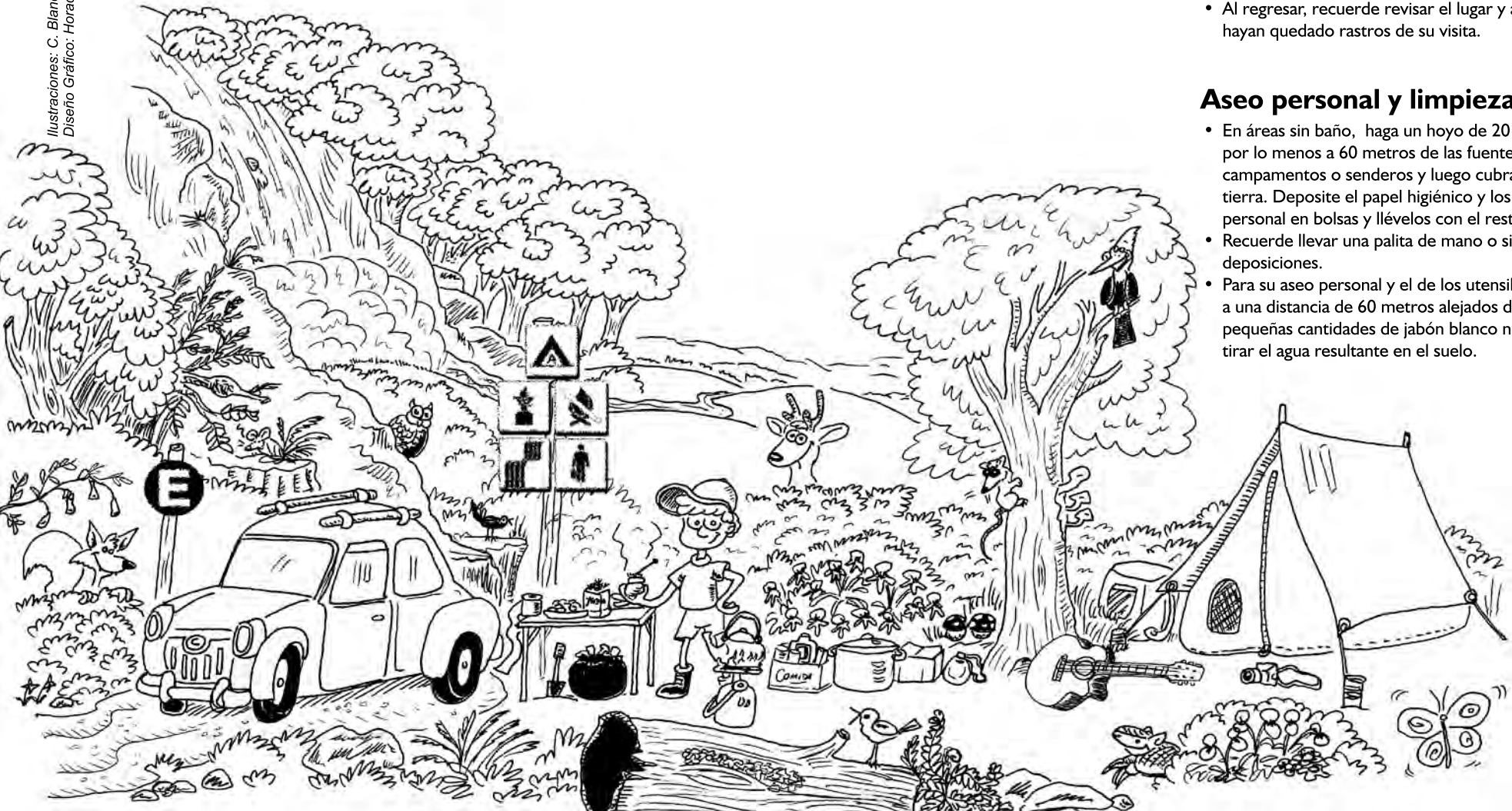
Ilustración para colorear